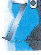
ACTIVITÉS DE RECYCLAGES RECICLADO DE INERTES

APPLICATIONS Démolition à l'intérieur de bâtiments avec matériaux manuels ou robotisés, recyclage, production de granulats, ramassage et réglage des sols, réglage et ciment, découpe et parage de mur, traitement des déchets.