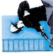
RESTAURATION ET RAVALEMENT RESTAURACIONES Y RESTABLECIMIENTOS