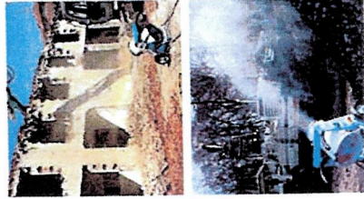
DF MINI PORTÉE MAXIMUM HORIZONTALE ALCANCE MAXIMUM HORIZONTAL