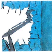
DÉMOLITIONS À L'INTÉRIEUR DE BÂTIMENTS DEMOICIONES INTERIAS

Los modelos Mini DF y DF Smart son nebulizadores estudiados justamente para cubrir áreas reducidas donde se tenga necesidad de limitar la emisión de polvos y olores. El Mini DF es un sistema de abatimiento de polvos con un tanque de agua de 70 litros incorporado, y se ha diseñado para trabajos pequeños en áreas internas: abatimiento o corte de muros interiores, remoción de pavimentos y en general para todos los trabajos de demolición, renovación y restablecimiento de locales internos y refriada de amianto. El modelo DF Smart en cambio se ha estudiado para las áreas externas, por lo tanto para pequeñas demoliciones, reciado de inertes, abatimiento o corte de muros y otros trabajos pequeños externos. Ambos productos se recomiendan en particular para el sector de alquiler. Gracias a sus dimensiones reducidas, estos dos modelos se pueden usar de manera práctica y rápida, pasan a través de las puertas, pesan poco y tienen consumos muy bajos. También su alimentación es muy simple, pudiendo ser conectados directamente a la red eléctrica doméstica.