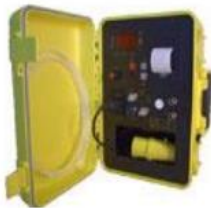
CM3 contrôleur de dépression

L'Autocommutateur est utilisé en relation avec le contrôleur de dépression ALERT CM3 pour déclencher automatiquement un extracteur d'air.