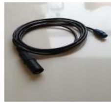
PSU – NPU cordon de liaison